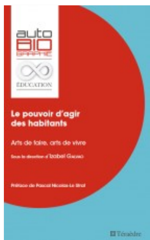
Le pouvoir d'agir des habitants. Arts de faire, arts de vivre