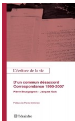
D'un commun désaccord. Correspondance 1990-2007