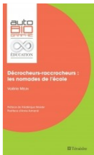
Décrocheurs-raccrocheurs. Les nomades de l'école